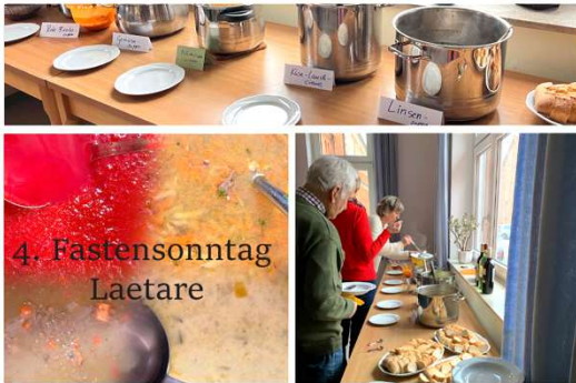
Fastenessen am 4. Sonntag der Fastenzeit

Seniorenachmittag: 20.05., 17.06., 15.07., 16.09.